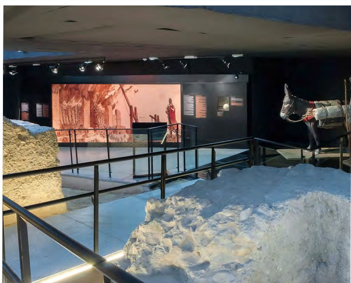
Imagen del interior del museo Mudem

¡Ahora sólo queda que pongas fecha a tu visita!