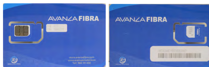
Tarjeta SIM personalizada de Avanza Fibra

Asimismo, la SIM cuenta con los tres tamaños de tarjeta que actualmente están en vigor.