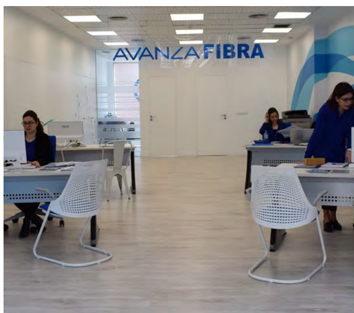
Tienda de Avanza Fibra en El Palmar