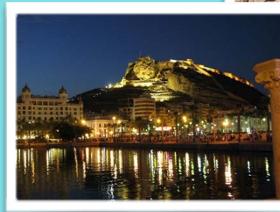
Vista nocturna Castillo de Santa Bárbara