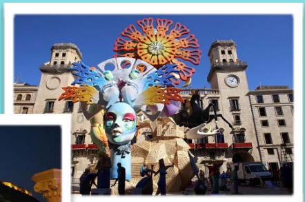
Imagen de una hoguera plantada

laboriosa manualidad, se queman en la "cremà" el día 24 de junio. Cada día a las 14 horas, se celebran las tradicionales " mascletàs ": un conjunto de tracas y estallidos que enfervoriza a los alicantinos. Las bandas de música son las encargadas de poner el toque alegre y festivo durante el día en la ciudad. La pólvora, su ruido y su olor, le recuerda a todo transeúnte que Alicante está en " Fogueres ". Y luego están las "kábilas" o cuarteles festeros, donde los lugareños se juntan cada día para disfrutar de las jornadas festivas. Braulio nos sugiere varios restaurantes y bares como ' El Valencia ' y el ' Nou Manolin ', locales de mucho nombre y de un corte más tradicional. En el parque ' La Ereta ' a las faldas del Castillo de Santa Bárbara , hay un restaurante de cocina vanguardista con unas vistas impresionantes de la ciudad.