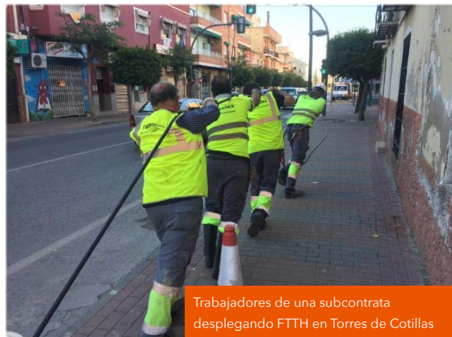
Trabajadores de una subcontrata desplegando FTTH en Torres de Cotillas

¡La construcción de las primeras Unidades Inmobiliarias (UU.II) correspondientes a la red de Masmóvil ya es una realidad! Nuestro equipo ha comenzado a desplegar Fibra Óptica en Las Torres de Cotillas, convirtiéndose en el primer municipio murciano en el que desembarcamos con nuestros diseños y aplicando tecnología de vanguardia. Varias empresas externas están trabajando, como subcontratas, en la construcción de la nueva red, aportando un capital humano de más de 50 personas, empleadas única y exclusivamente para este fin. Esto tan solo es el comienzo del servicio que Avanza Solutions ofrecerá a las más de 150.000 UU.II. comprometidas con Masmóvil para la Región de Murcia dentro del Plan de Despliegue , que fue firmado el pasado mes de diciembre. Un ambicioso proyecto que ha supuesto, entre otros, el crecimiento de Avanza como empresa especializada en construcción de redes de Fibra Óptica . La