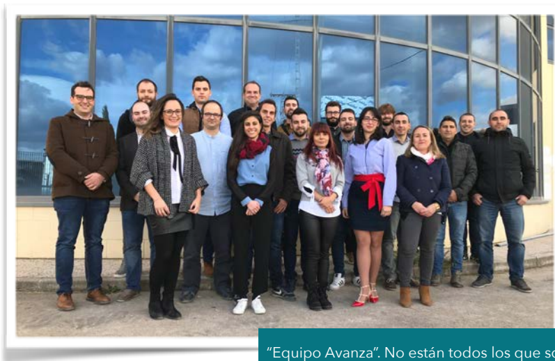
"Equipo Avanza". No están todos los que son, pero son todos los que están.

de Formación, Call Center, Cocina, Sala de Raw y espacio EcoAvanza. En la primera planta se ubicará Administración, Financiero, Jurídico/Laboral, Dirección, Gerencia y Sala de Juntas. El exterior se caracterizará por ser un espacio que estará destinado al recreo del personal y visitantes. Se pondrá a disposición de otras empresas de la Región para exposición de productos ecológicos y artesanos, abarcando incluso el campo de la gastronomía y de la moda. A mediados de este mes de febrero se realizará el traslado a la planta baja. En las siguientes semanas a este primer paso, se irán adaptando el resto de áreas hasta que todo el mundo ocupe su correspondiente puesto de trabajo. "El cambio es fruto de nuestro crecimiento y agradecemos a nuestros trabajadores el esfuerzo y la paciencia que están teniendo con todo esto, porque requiere un trabajo adicional a la carga diaria que tenemos. Es por el bien de todos, es por el bien de Avanza", coinciden en apuntar Juan Francisco Navarro y Mariano Martínez, Administradores de Avanza Solutions. "El cambio es ley de vida. Cualquiera que solo mire al pasado o al presente, se perderá el futuro", J.F. Kennedy.